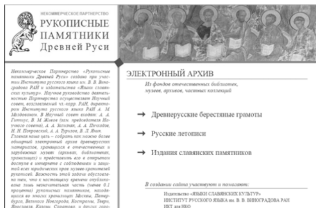
Рис. 1. Фрагмент партнерского сайта «Рукописные памятники Древней Руси»

Познавательная направленность подразумевает передачу информации общего познавательного характера. Это информация, касающаяся определенных тематических разделов теории и практики русского языка. Ресурсы познавательной направленности обычно адресуются пользователям широкого круга. Это могут быть необязательно студенты, словесники, преподаватели. Это могут быть и те, кто интересуется проблемами родного языка, и даже иностранцы, изучающие русский язык с различными целевыми установками. Например, портал «Институт русского языка» приводит ссылку на ресурс «Рукописные памятники Древней Руси» (рис. 1).